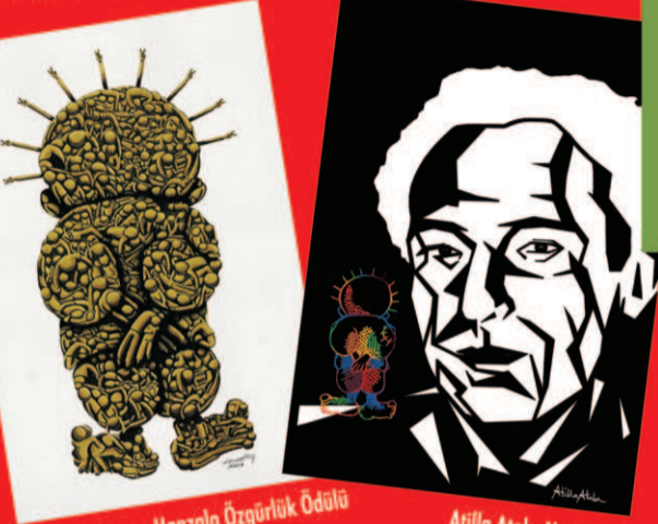
Necmettin Asma-Hanzala Özgürlük Ödülü